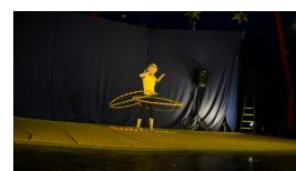
Abschluss- aufführung der Zirkuskurse