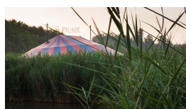
Zirkuszelt Auf- und Abbau